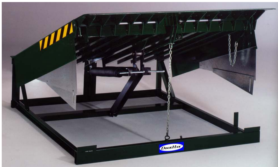
Рис.1. Механическая уравнительная платформа

Уравнительная платформа с поворотной губой (Доклевелер) предназначена для осуществления погрузочных и разгрузочных работ.