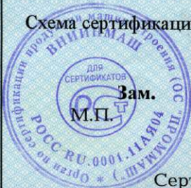
Схема сертификации За